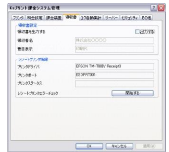
レシート設定画面