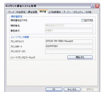
レシート設定画面