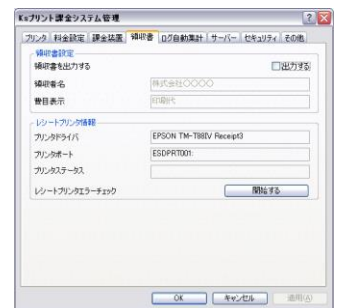
レシート設定画面