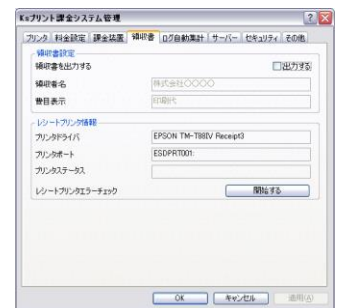
レシート設定画面